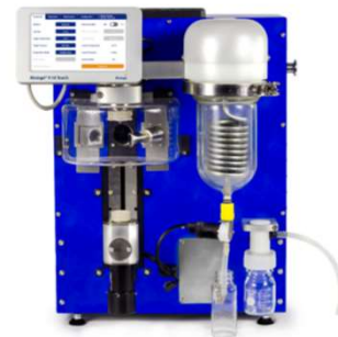
高速エバポレーションシステム V-10 Touch*