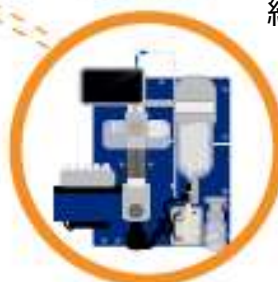
V-10 Touch Evaporator