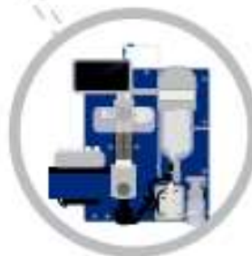
V-10 Touch Evaporator