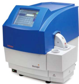
マイクロウェーブ合成装置 Initiator+