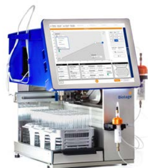
最新超高速フラッシュ自動精製システム Biotage® Selekt

システム構成等、ニーズに合ったご提案をさせていただきます。 詳細はお問い合わせください。